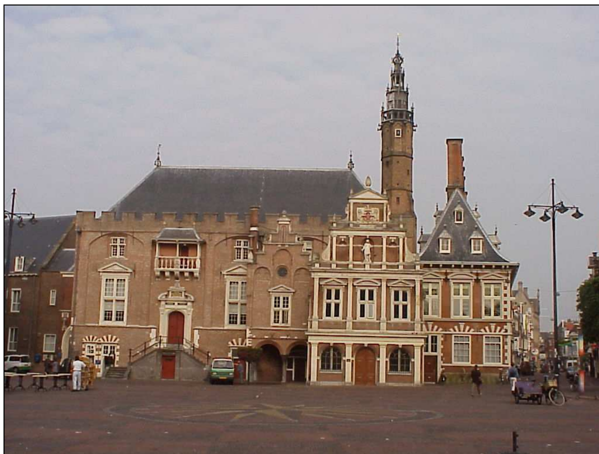
Het stadhuis van Haarlem

De belegering van Haarlem in de Tachtigjarige Oorlog in 1572-1573 was een ramp. Het garnizoen werd uitgemoord en de schade aan de stad was enorm. Drie jaar later zorgde een grote stadsbrand opnieuw voor een ravage: ongeveer een kwart van de gebouwen moest het ontgelden. De wederopbouw van de stad kon enkele jaren later voortvarend worden aangepakt. De Staten van Holland stonden de stad namelijk toe de in beslag genomen gelden en goederen van de vele katholieke kloosters en kerken voor het herstel van de stad te gebruiken. Toen was er opeens geld genoeg om de stad te herbouwen. Aanvankelijk gebeurde dat onder leiding van stadsbouwmeester Willem Diricxz den Abt en vanaf 1593 onder stadsarchitect Lieven de Key (omstreeks 1560-1627). Vooral deze laatste heeft nadrukkelijk zijn stempel op gebouwen in de binnenstad gedrukt. Zo ontwierp hij onder andere de Vleeshal aan de Grote Markt, gebouwd in 1603.