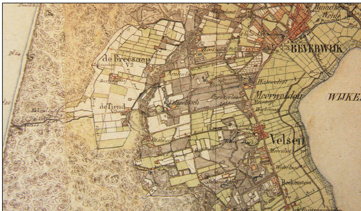
Het duingebied ten westen van Velsen omstreeks 1850, vóór de aanleg van het Noordzeekanaal