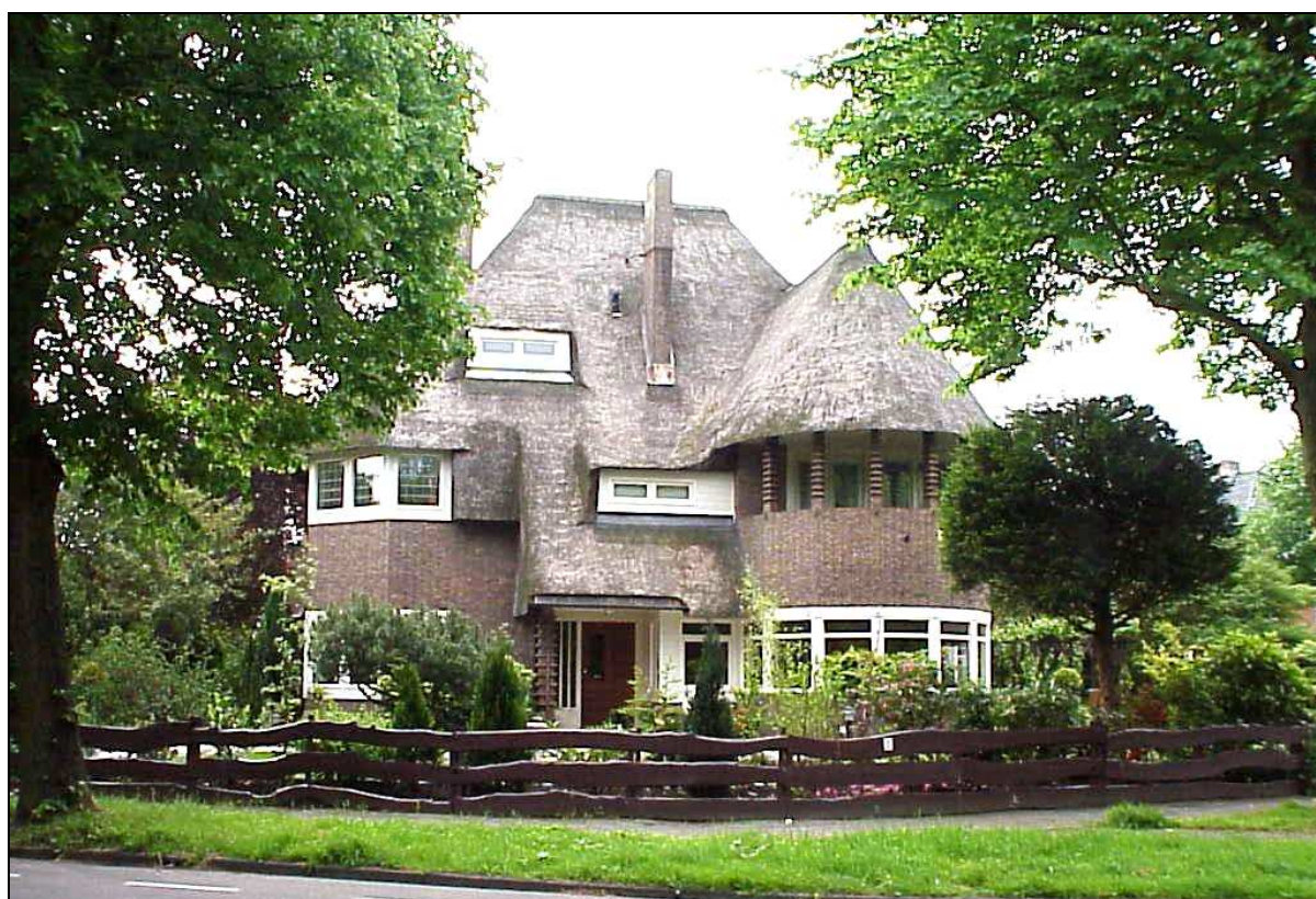
Villa in Aerdenhout

In Kennemerland was veel grond, met name in het duingebied, in handen van grootgrondbezitters. Deze zagen de waarde van hun grond – tot die tijd vrijwel uitsluitend gebruikt als jachtgebied – door de ontwikkeling tot villapark spectaculair stijgen. De villaparken werden over het algemeen ontwikkeld door exploitatiemaatschappijen. Er werd een stuk grond gekocht, het liefst op een bestaand landgoed, zodat al een landschapspark aanwezig was dat een aantrekkelijke entourage voor de nieuwe villa's kon vormen.