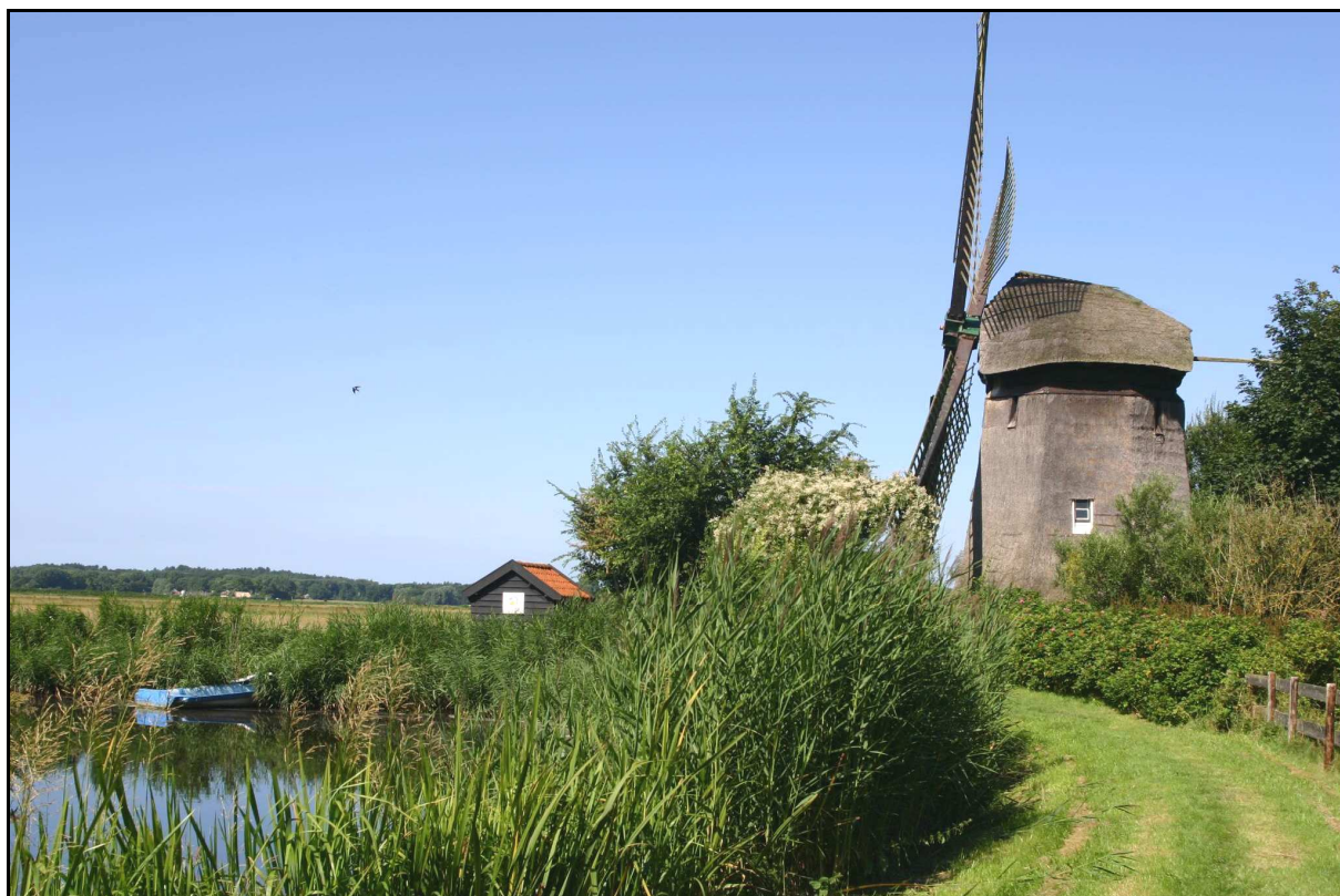
Bergerringvaart, Damlandermolen en de duinen op de achtergrond

bedreigd. Er werden dijken aangelegd om woonplaatsen en landbouwgronden tegen het hoge buitenwater te beschermen.