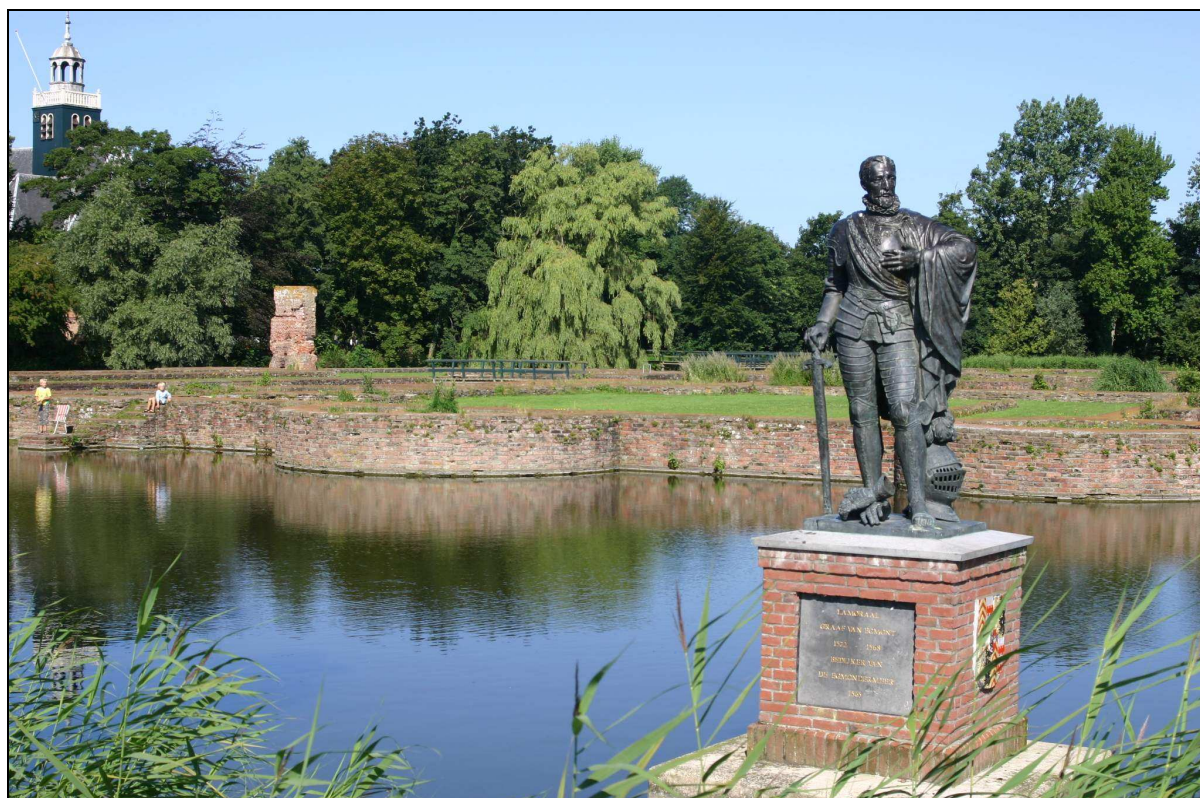
Egmond aan de Hoef, de ruïnes van het kasteel van Egmond met het beeld van graaf Lamoraal van Egmond.