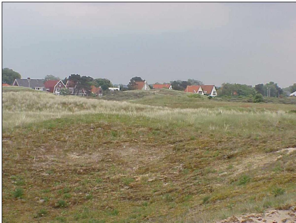
Het duingebied bij Zandvoort

Dit keurig geordende natuurlandschap wordt door het Noordzeekanaal doorsneden, waardoor Kennemerland in een noordelijk en een zuidelijk deel wordt verdeeld.