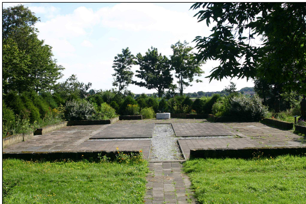
De St.-Aelbertspuit en de contouren van het kerkje, Egmond-Binnen

Graaf Dirk I van Holland liet de overblijfselen van Adalbert overbrengen naar het nieuw gebouwde klooster. Op de plaats van het oude graf ontsprong een bron met geneeskrachtig water. Volgens de annalen werd de bron al spoedig een veelbezocht bedevaartsoord en vonden veel blinden en 'bezetenen' hier genezing. De monniken van Egmond hebben op deze plek in de twaalfde eeuw een kerkje gebouwd. Deze kerk is in de zestiende eeuw door oorlogshandelingen verloren gegaan, net als de abdijgebouwen, die in 1573 door de Geuzen zijn verwoest. De St.-Aelbertspuit is gerestaureerd en de vorm van de verdwenen kerk is weer zichtbaar gemaakt.