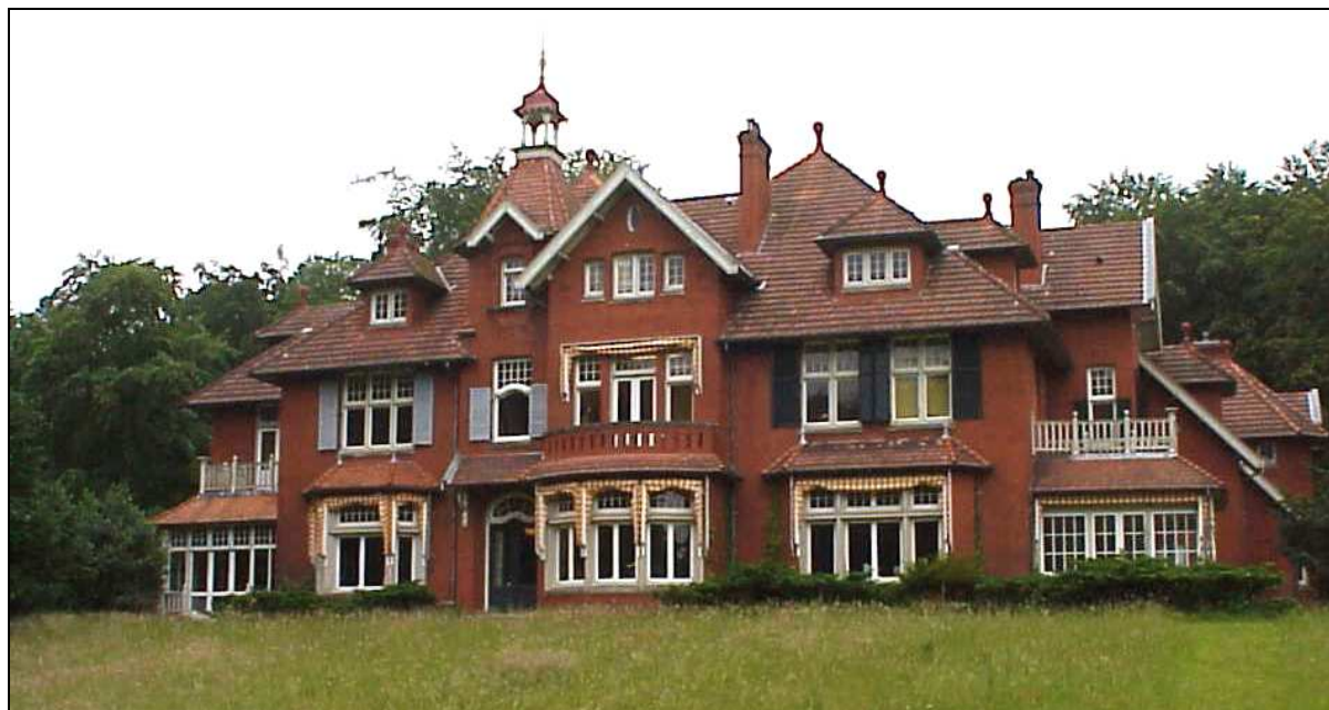
Koningshof bij Bloemendaal, gebouwd in 1899. Eén van de laatste buitenplaatsen die tot dusverre in Kennemerland zijn aangelegd. De architect, A. Salm, heeft zich laten inspireren door de negentiende eeuwse Engelse landhuisbouw. Het park in bijpassende Engelse landschapstijl is ontworpen door L.A. Springer.

Bij een deftig huis hoort natuurlijk een mooi aangelegde tuin. Net als in de architectuur is ook de tuin- en landschapsarchitectuur aan mode onderhevig. De zeventiende en begin achttiende eeuwse tuinen werden gekenmerkt door hun formele aanleg met strenge zichtlijnen, strak geschoren buxushaagjes en geometrische vormen. Aan het eind van de achttiende eeuw raakt men hier op uitgekeken en deed de Engelse landschapstuin zijn intrede. Geen strakke lijnen meer, maar slingerende paadjes, romantische boomgroepen en verrassende doorkijkjes. Nieuwe parken werden in deze stijl aangelegd, veel oude, formele tuinen werden aangepast, zoals Waterland en Velserbeek. Niet onbelangrijk hierbij was dat een tuin in de Engelse landschapstijl heel wat goedkoper in het onderhoud was dan een tuin in formele stijl. Het buitenplaatsenlandschap van Kennemerland veranderde geheel van karakter. In de negentiende en begin twintigste eeuw ging deze ontwikkeling door, waarbij kenners de vroege, de volle en de late landschapstijl onderscheiden. In elk geval was er voldoende werk voor belangrijke landschapsarchitecten, zoals Springer, Zoicher en Copijn, die werden ingeschakeld om de parken van de nodige allure te voorzien.