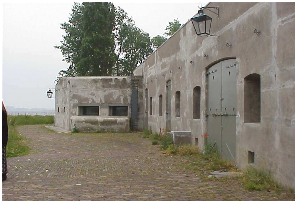
Fort Bezuiden Spaarndam

inundatiegebieden en andere militaire werken rondom de hoofdstad. Inundatiegebieden zijn landerijen die normaal gesproken door boeren worden gebruikt maar die in geval van oorlogsdreiging onder water gezet konden worden. De hele stelling heeft een lengte van maar liefst 135 kilometer en bestaat uit 49 forten, die gemiddeld ongeveer 3 kilometer uit elkaar liggen. Voor de verdedigingsgordel moesten uitgebreide werkzaamheden worden verricht: niet alleen het bouwen van de forten zelf, maar ook kaden, sluizen en duikers ten behoeve van de inundatiegebieden.