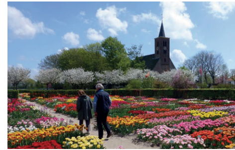
'Limbon' Prot. Kerk en entree Hortus Bulborum

» RA Zuidkerkelaan: Bij Rijksweg LA fietspad naar stoplichten (niet oversteken, rij klein stukje rechtdoor in doodlopend stuk tot op de brug.)