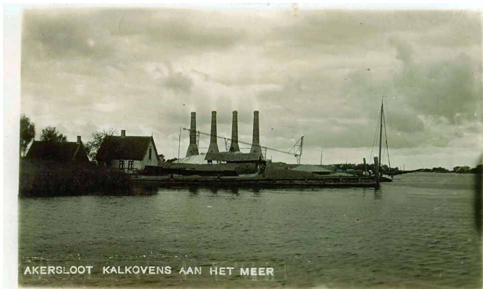
Zicht op 't Stet met kalkovens van de firma Ruigewaard.