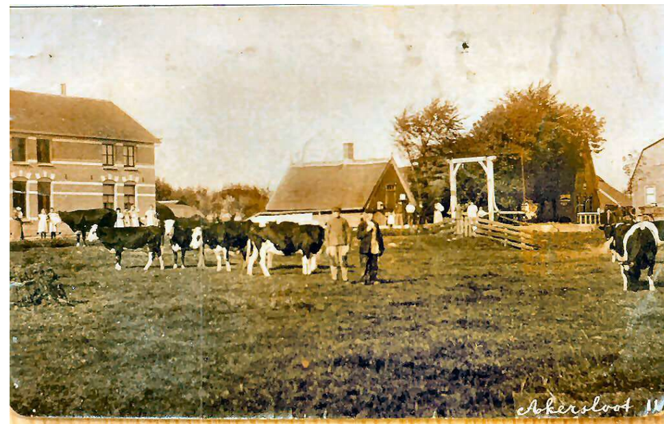
Zicht op de Sluisbuurt rond 1915. In het midden het sluicewachtershuisje en de ophaalbrug.

» Over de brug kom je op de Fielkerweg /Klein Dorregeest.